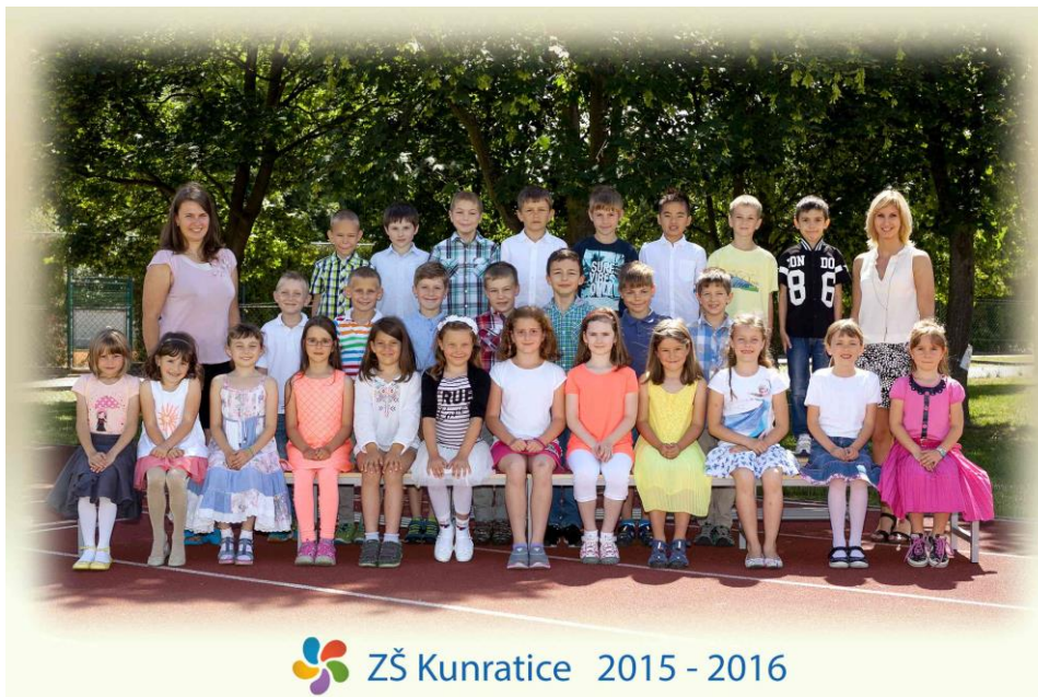
ZŠ Kunratice 2015 - 2016

Od roku 2010 je naše škola zapojena do mezinárodního programu GLOBE. GLOBE je zaměřen na přírodovědná pozorování v terénu a na zkoumání přírody v okolí své školy prostřednictvím badatelsky orientovaného vyučování. Sledujeme životní prostředí ve čtyřech oblastech: meteorologie, hydrologie, fenologie a pedologie. Svá zjištění konzultujeme s odborníky a navrhujeme řešení environmentálních problémů a ta, která jsou pro nás dosažitelná, ta se snažíme uskutečňovat. Námi naměřená data slouží také vědcům k ověřování různých hypotéz a modelů a jsou k dispozici i široké veřejnosti na adrese www.globe.gov . GLOBE tým úzce spolupracuje se školním EKOPARLAMENT. Letos se náš tým rozšířil nově o žáky prvního stupně - Gloubík. Každý rok se účastníme s ostatními GLOBE týmy celostátního setkání GLOBEGames. Tento rok budeme hostit GLOBEGames u nás v Kunraticích. V našem školním Projektu pedagogického rozvoje školy (PPRŠ) se v současné době se zaměřujeme na využití metod badatelsky orientovaného vyučování.