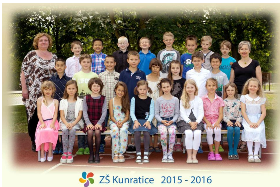
ZŠ Kunratice 2015 - 2016

Výchovný poradce je garantem profesní orientace žáků devátých, popř. pátých tříd. Spolupodílí se na přípravě, průběhu a vyhodnocení komplexní diagnostiky studijních předpokladů žáků 9. (event. 5.) tříd. Společně se školním psychologem poskytuje odborné poradenství a individuální konzultace zákonným zástupcům a žákům při výběru vhodného studijního programu. Zachycuje a se školním psychologem konzultuje výchovné problémy žáků.