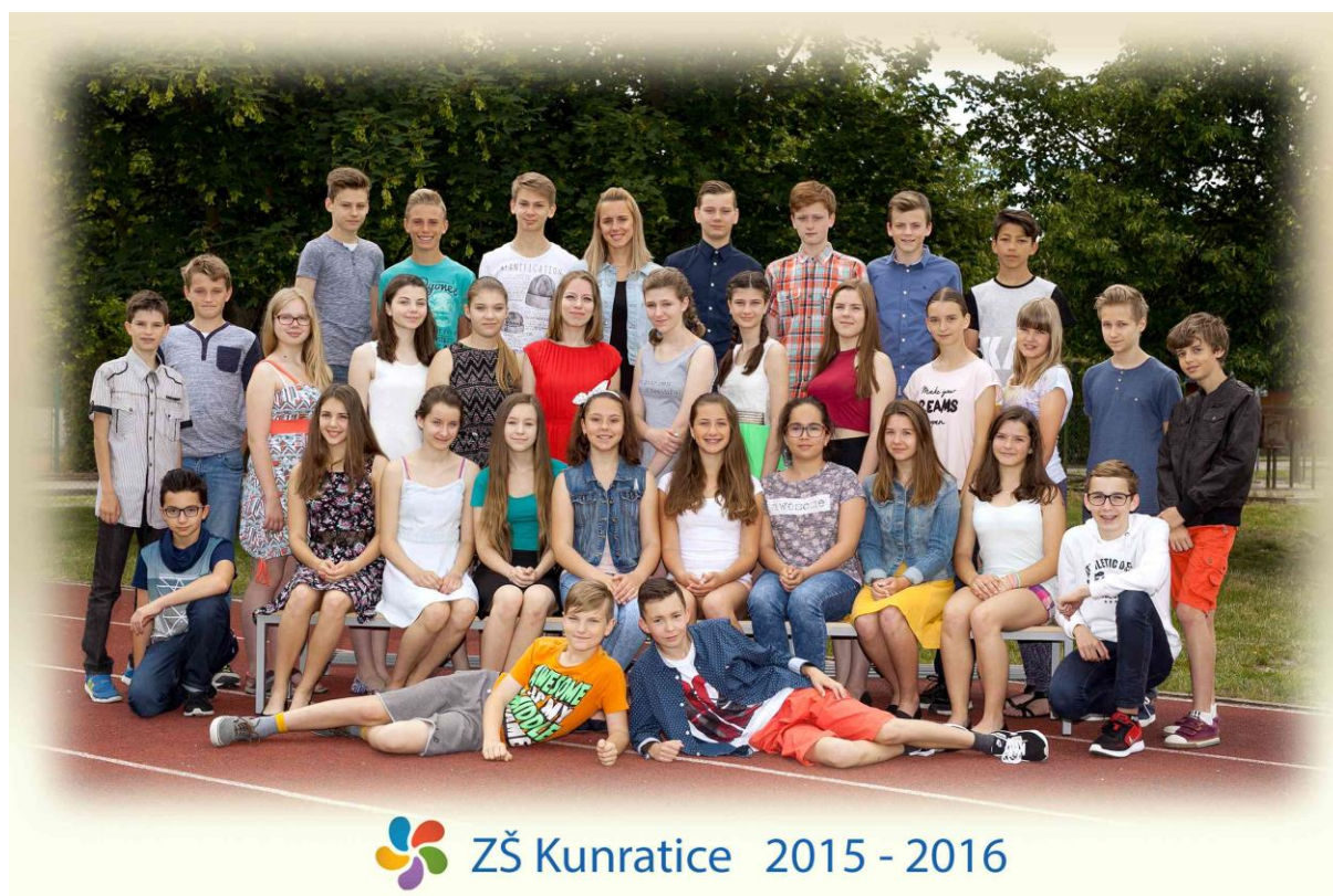
ZŠ Kunratice 2015 - 2016